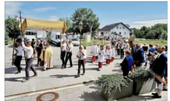
Die Prozession auf dem Weg zum Außenaltar.