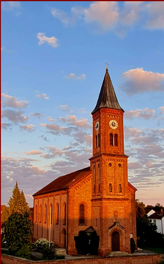
Patrozinium St. Johannes Baptist Pfarrei Ittling Bistum Regensburg Dekanat Straubing-Bogen